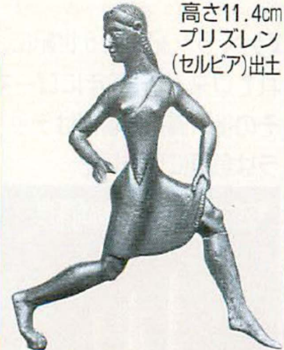
高さ11.4cm プリズレン (セルビア)出土